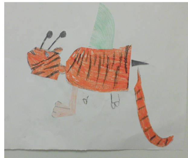
Werk vom Thementag „Fabeltiere“