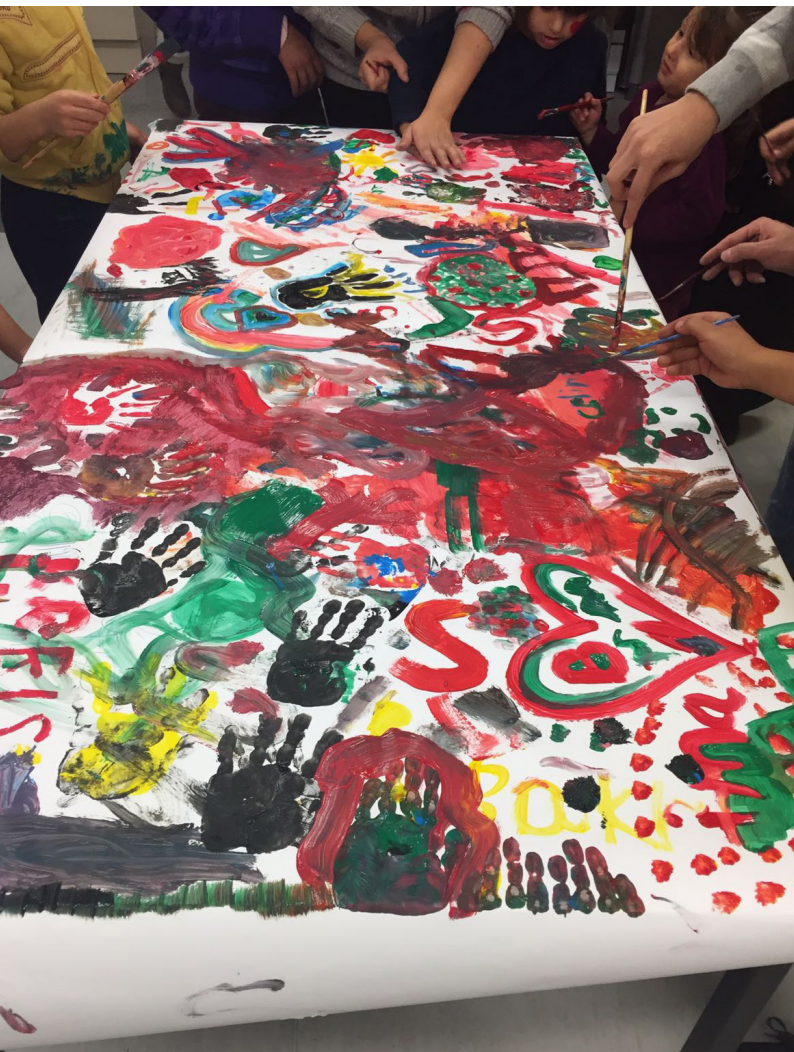
Das erste Gruppenbild

Vom April 2016 bis Juli 2017 führten Studierende des Studiengangs "Expressive Arts in Social Transformation" der MSH Medical School Hamburg ein künstlerisches Projekt mit Bewohnerinnen und Bewohnern der Flüchtlings-Wohnunterkunft Paul-Sorge-Straße in Hamburg-Niendorf durch. Unter Supervision eines Dozenten des Kunst-Departments der MSH bot das studentische Team wöchentlich eine Kunstwerkstatt an, die offen für alle Altersgruppen war, aber hauptsächlich von Kindern im Grundschulalter genutzt wurde. Das intermediale künstlerische Angebot wurde in hohem Maße von den internationalen Teilnehmenden der Werkstatt mitbestimmt. Interkultureller Austausch, individueller Ausdruck, Integration, Kommunikation und der Erwerb sozialer Kompetenzen gehörten zu den Zielsetzungen des Angebots. Im Sommer 2016 wurde das Projekt von Studierenden des Jahrgangs 2014 an Studierende des Jahrgangs 2015 und 2016 übergeben. Finanziert wurde das Projekt durch eine Spende des Kinderladens Rombergstraße e.V. in Hamburg-Eimsbüttel.