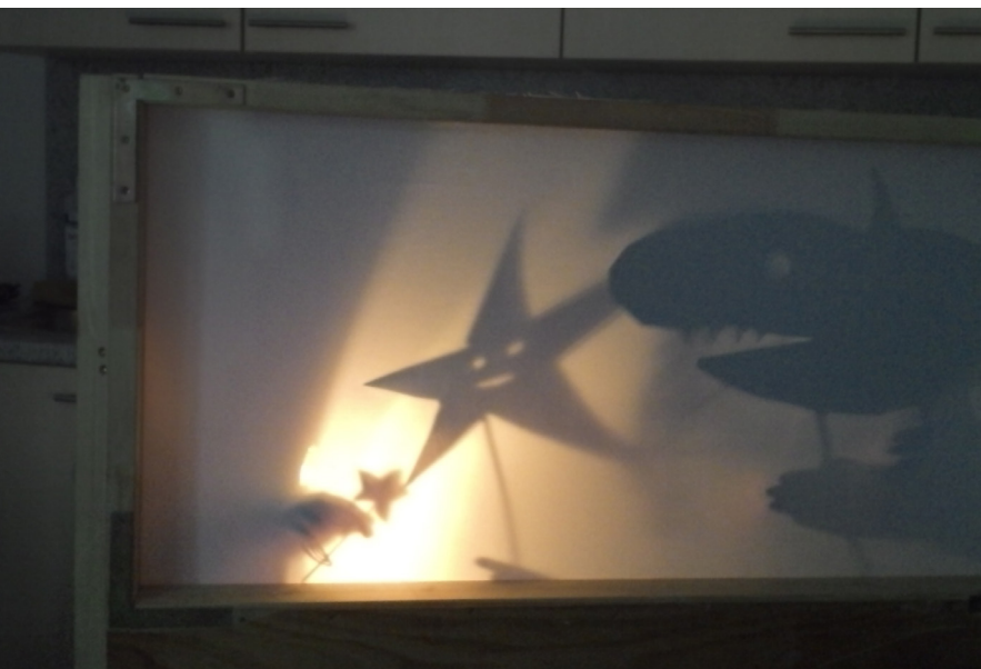
Verzierung des Schattentheaters